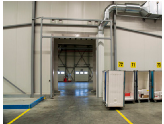
Aanzicht vanuit vriescel